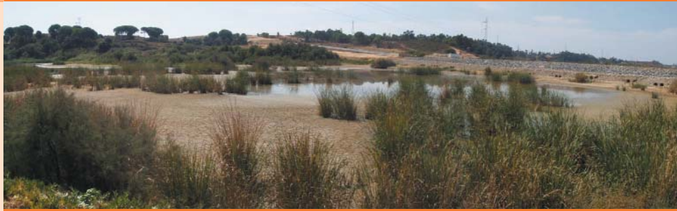
Estero de Domingo Rubio (Otoño 2003)