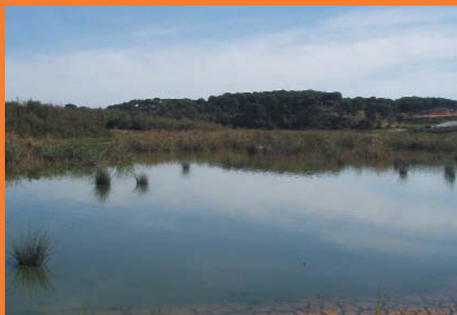
Estero de Domingo Rubio (Otoño 2002)

El conjunto de marismas y esteros del litoral atlántico andaluz forma uno de los más importantes complejos palustres litorales de la Península. El Estero de Domingo Rubio presenta un destacable desarrollo de la vegetación palustre. Sustenta una rica y variada avifauna, contribuyendo a diversificar, junto con el resto de humedales litorales onubenses, los hábitats que sirven de refugio a numerosos contingentes de aves en sus trayectos migratorios.